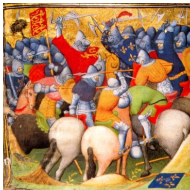
그림 4. 백년 전쟁

임진왜란도 전면전에 해당합니다. 당시에는 공군이 없었고, 일본이 당나라로 가는 길을 요구하면서 침략했지만, 그 기저에는 조선을 차지하려는 야욕이 있었기에 이것도 전면전입니다.