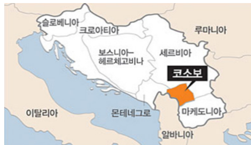
그림 2. 코소보 전쟁

먼저 코소보 전쟁은 지상군이 투입되지 않고 해공군력으로만 전쟁이 끝난 경우입니다. 이것도 전면전에 해당이 됩니다.