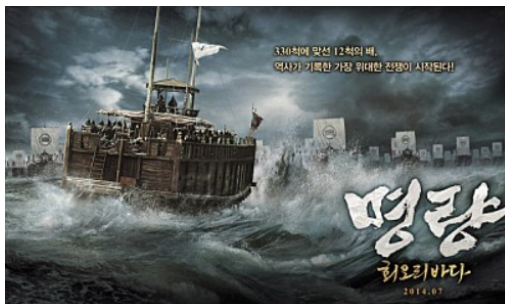
그림 3. 임진왜란

먼저 코소보 전쟁은 지상군이 투입되지 않고 해공군력으로만 전쟁이 끝난 경우입니다. 이것도 전면전에 해당이 됩니다.